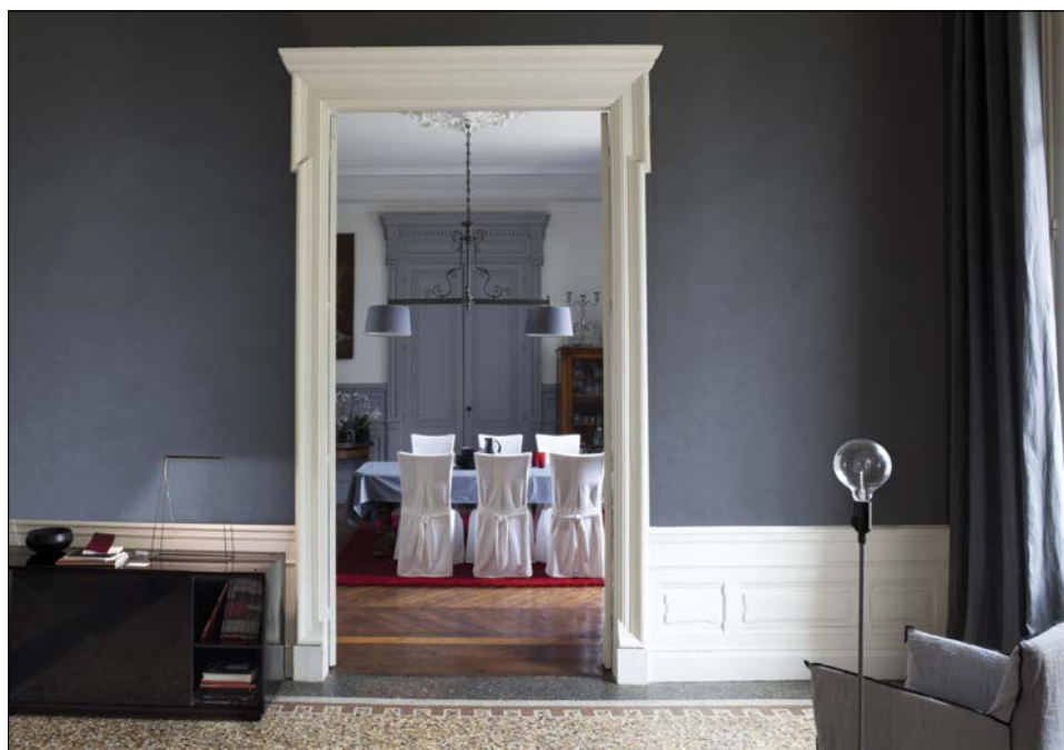
Aspect « lissé », teinte Atlanta

Fiches techniques disponibles sur le site Internet www.guittet.com